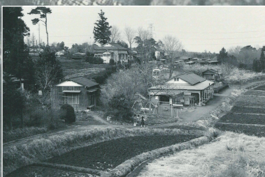
武者小路実篤と毛呂山に築いた新しき村