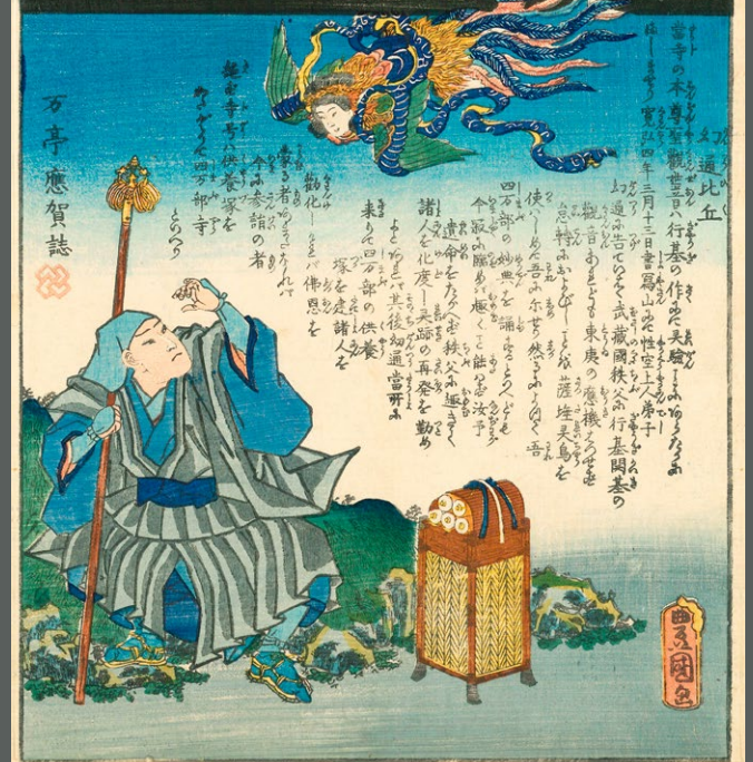
観音霊験記 秩父順礼 第一番 四萬部寺