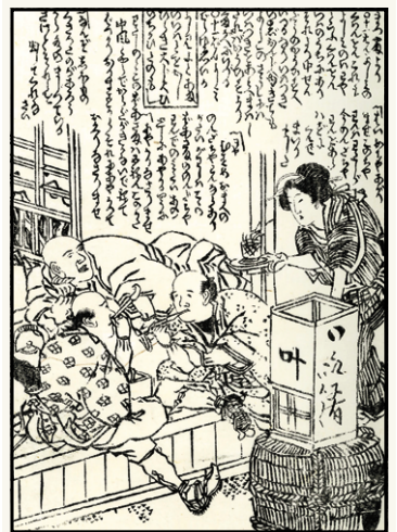
十辺舎一九『金草鞋』